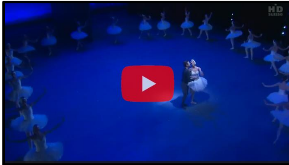
Vídeo: El Llac dels Cignes

No et quedis sense escoltar aquesta meravellosa obra, i millor amb uns bons auriculars.